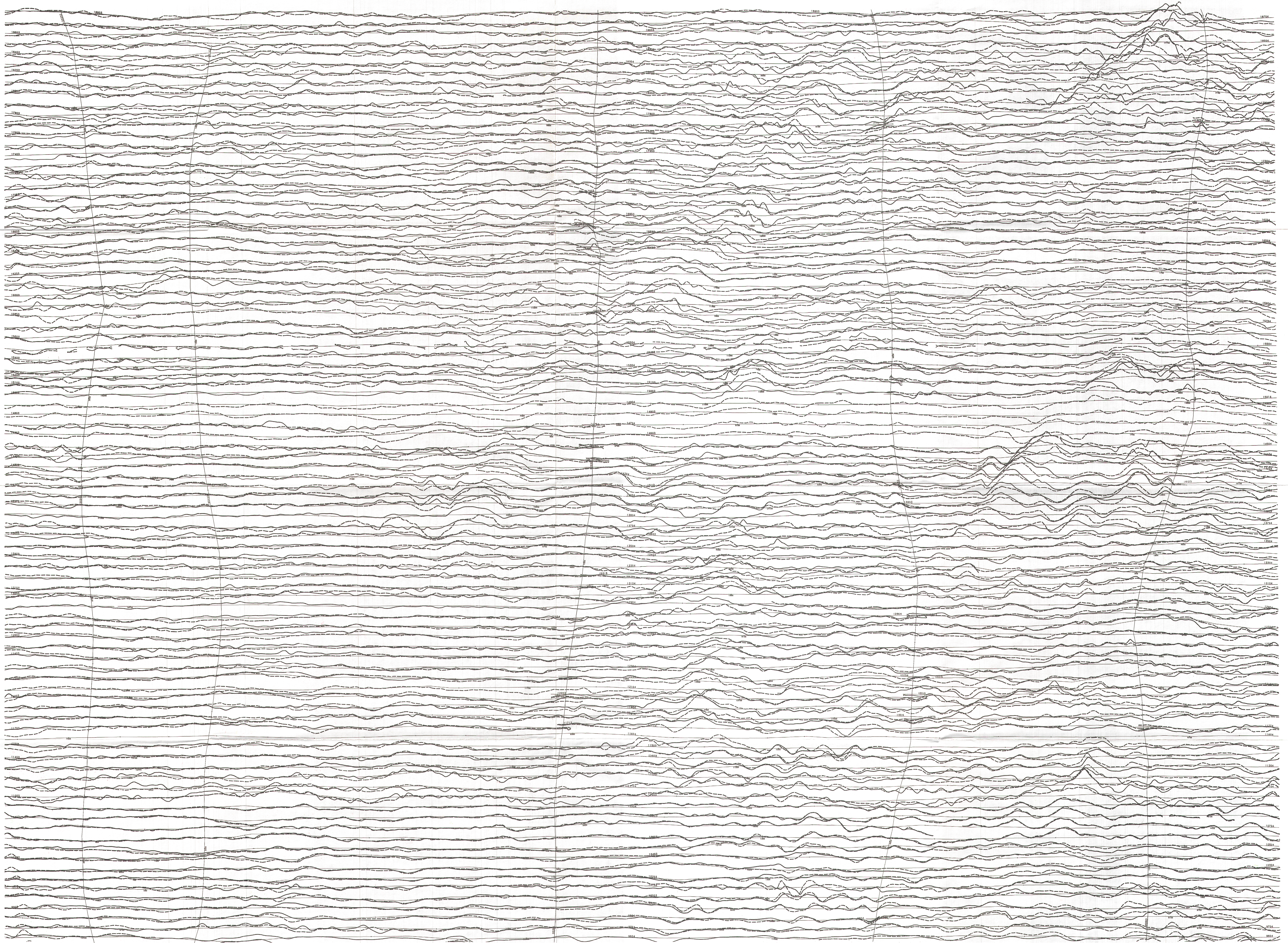
TOTEM VLF EM TOTAL FIELD PROFILES PROFILS DU CHAMP TOTAL TOTEM EM VLF