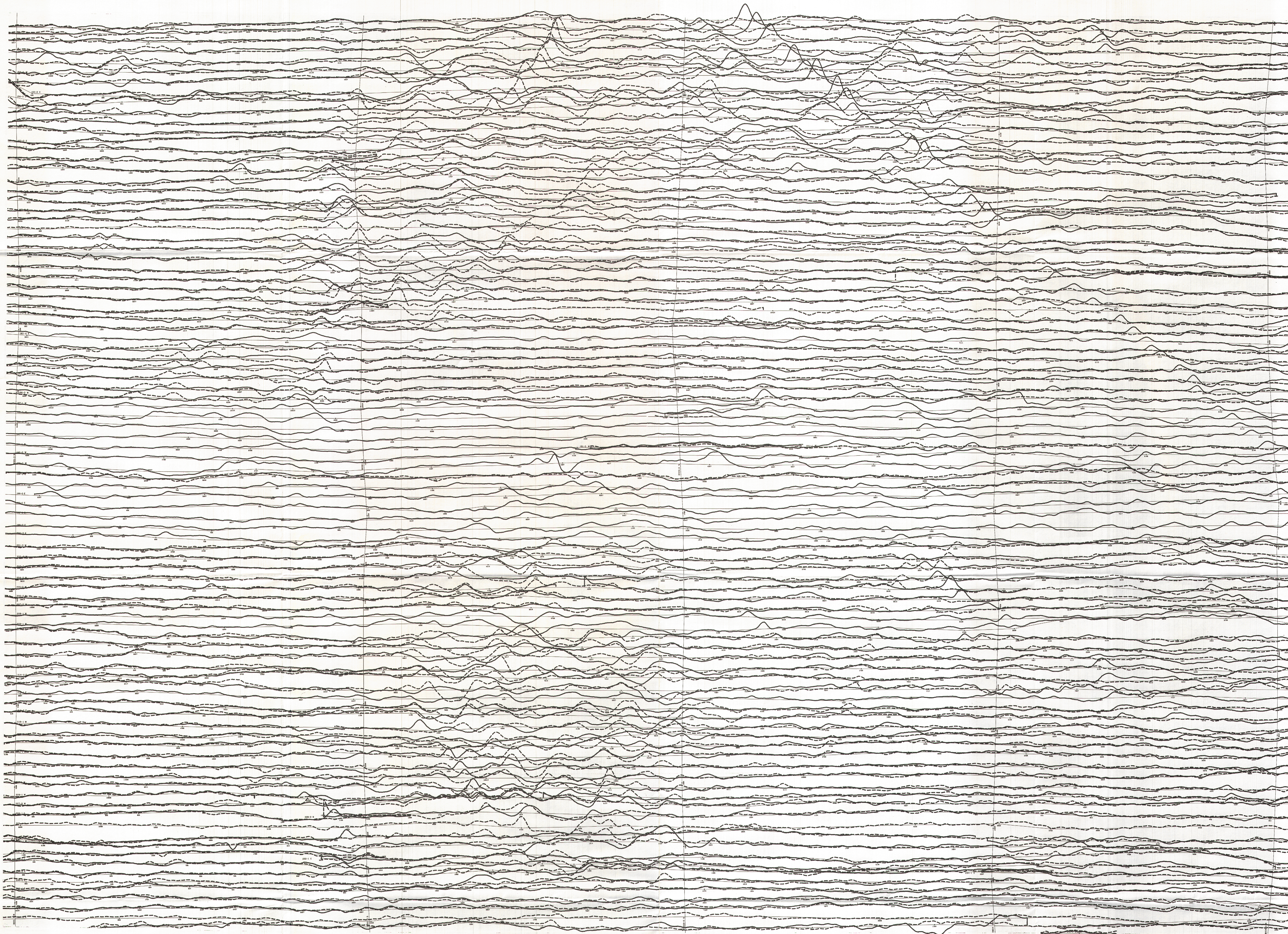
TOTEM VLF EM TOTAL FIELD PROFILES PROFILS DU CHAMP TOTAL TOTEM EM VLF