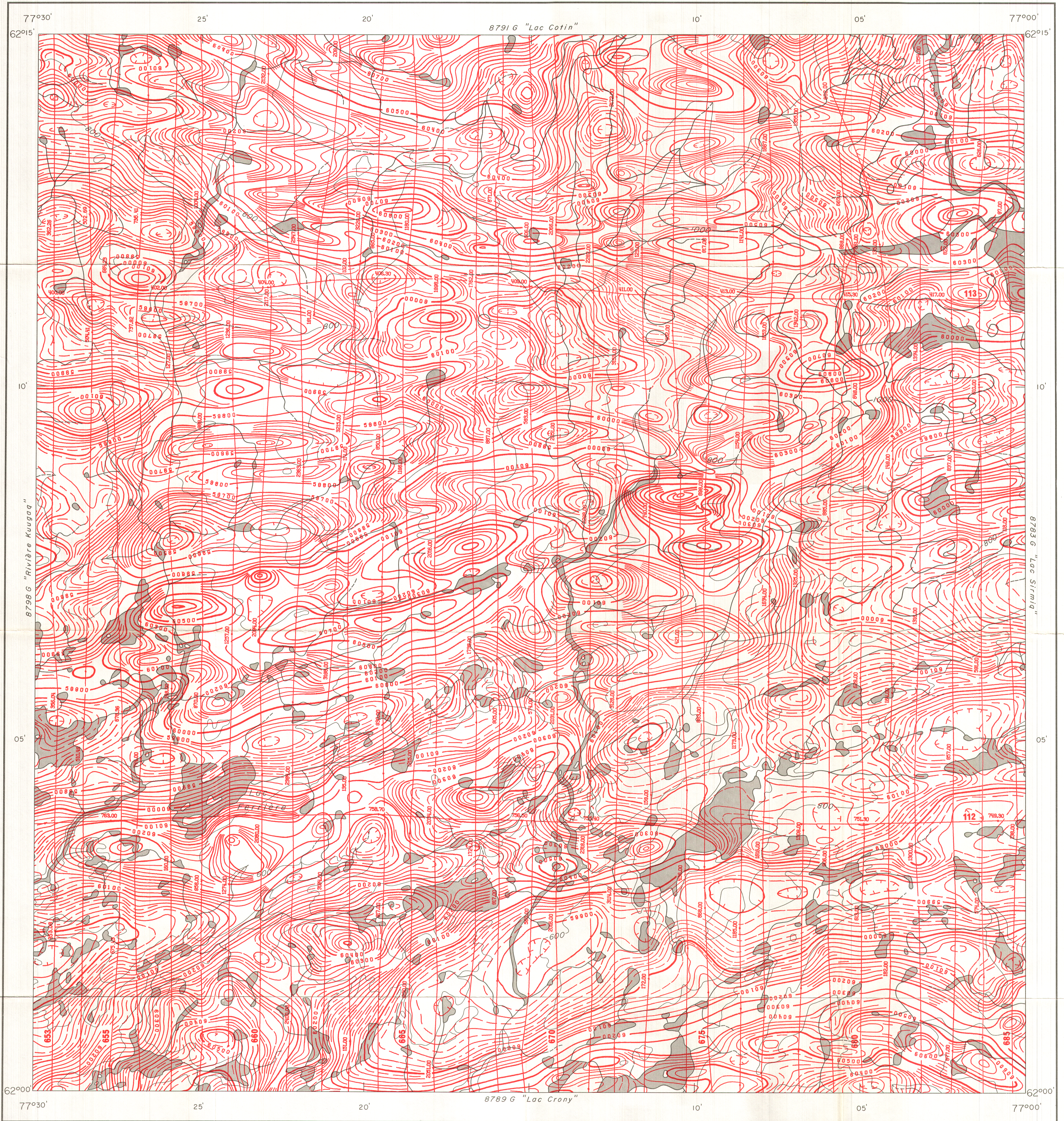
CARTE - MAP 8790 G