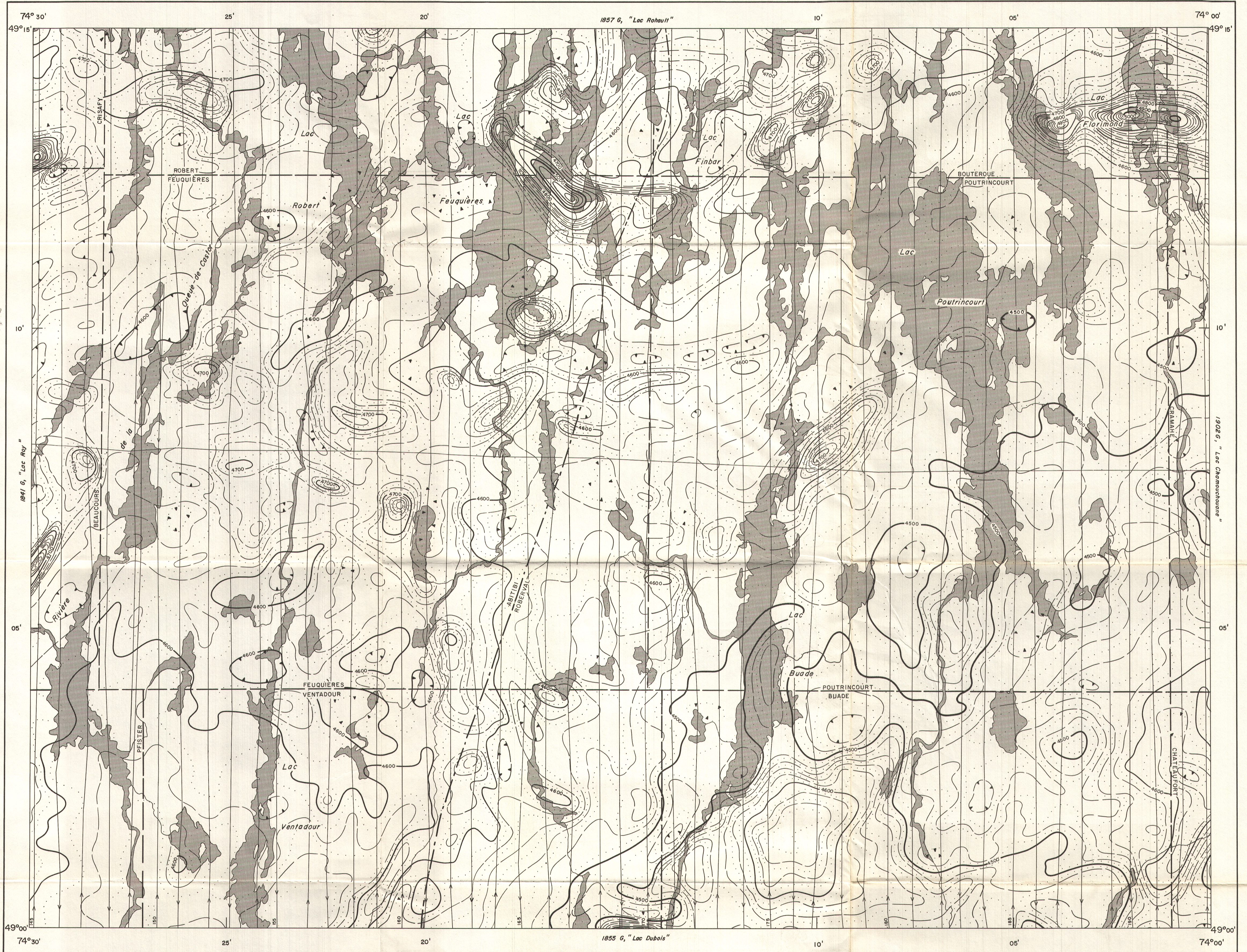
MAP CARTE 1856G