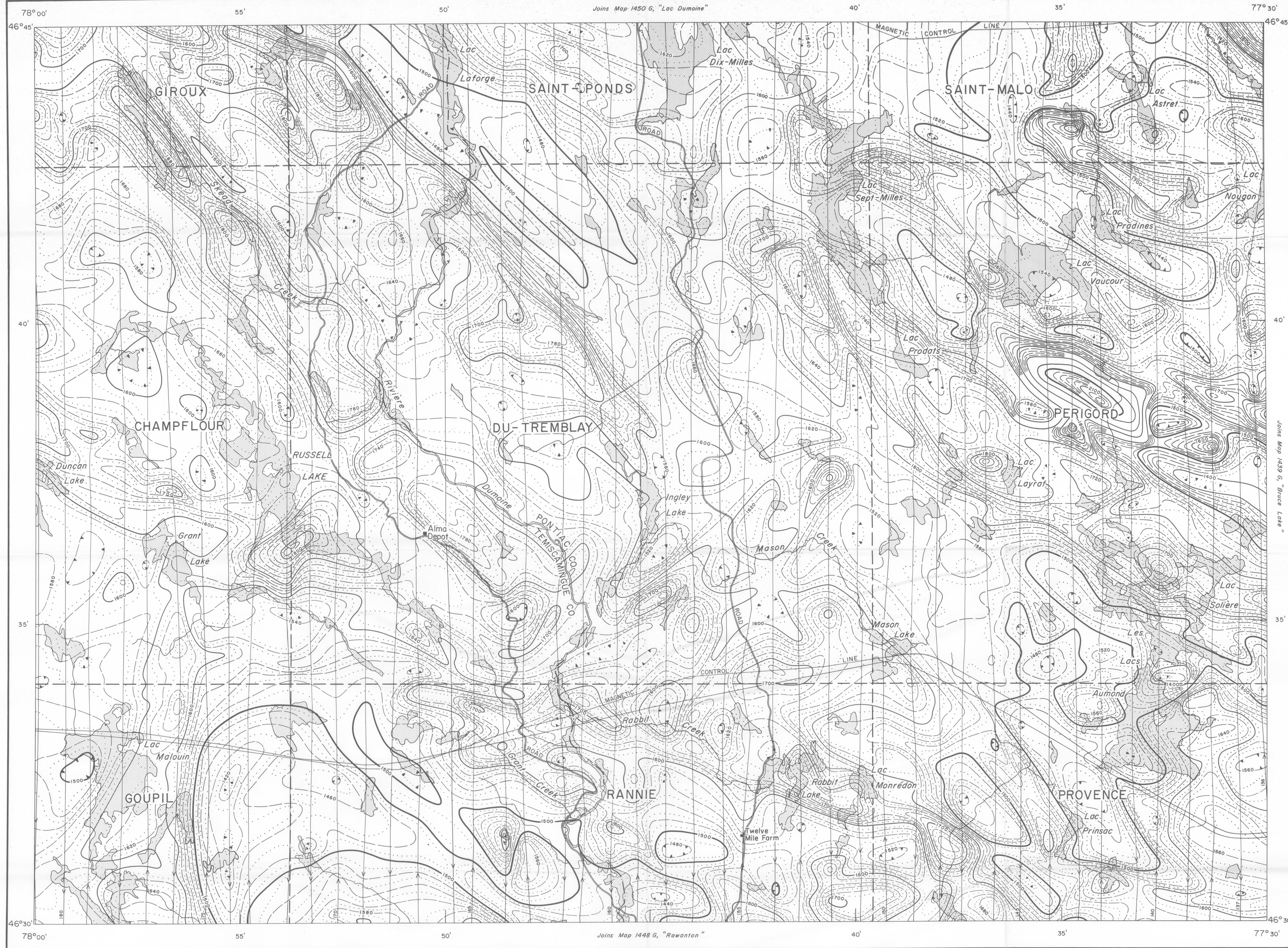
MAP 1449G CARTE